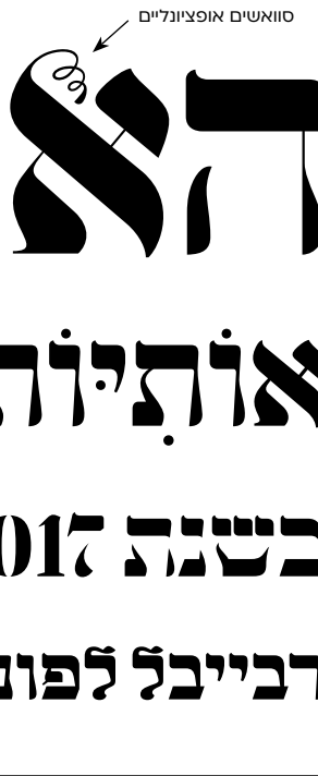
משקל לייט 102 pt

הוא חשד רבנים אותיות במבנה מרבע ומעפר! בשנת 2017 הוספו משקל הסגולה מטריה רבייבל לפונט קלאסי בעל קשר חזק לאות היוגנדסטיל