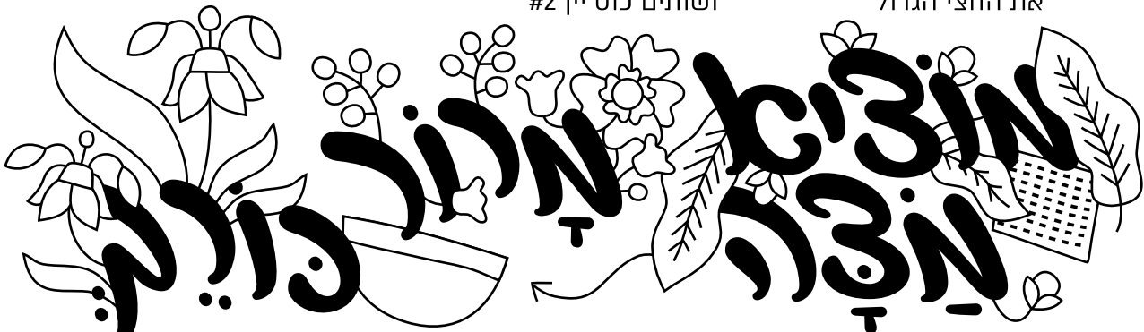
מכינים סנדביץ' מצה עם חסה וחרוסת