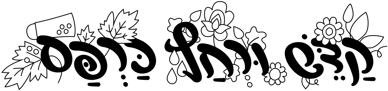
טובלים כרפס במי מלח ואוכלים