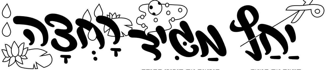
נוטלים את הידיים ומברכים